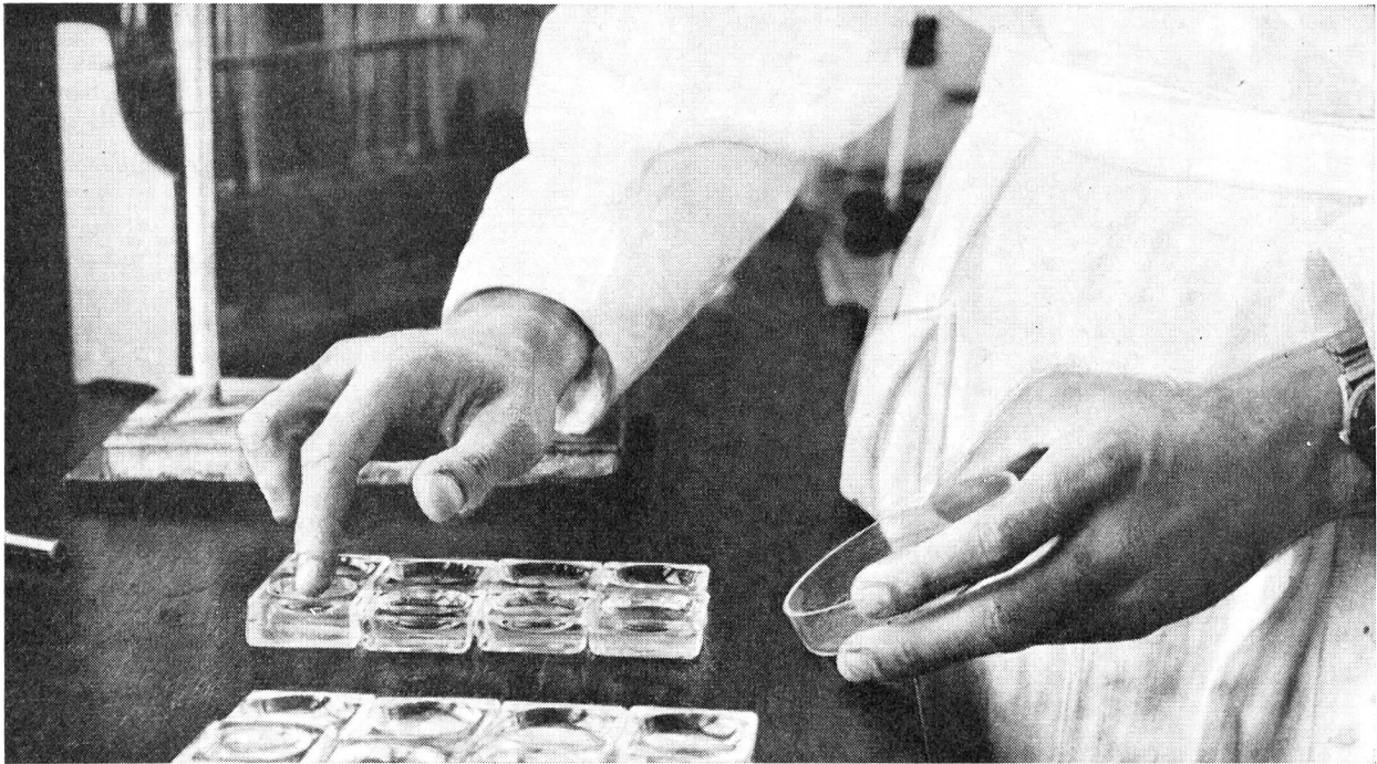
Die Kulturen werden mit Pollen beimpft, indem man die Pollen mit dem Finger auf den Agarboden aufstupft.

Die Bilder der Seiten 18 und 19, die von Hans Tschirren, Bern, aufgenommen worden sind, gehören zum Aufsatz «Auf den Spuren eines Gelbsuchtfaktors» von Dr. F. H. Schwarzenbach auf Seite 3.