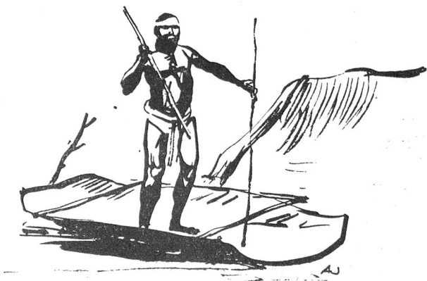
Die australischen Eingeborenen sind ausgezeichnete Fischer.

Die Frage nach der Herkunft der Australier stellt nach wie vor ein ungelöstes völkercundliches Problem dar. Unseren Lesern vom Leben dieser rätselhaften Eingeborenen jenes fernen Erdteils zu erzählen und ihnen die Wedda Ceylons gegenüberzustellen, ihnen ferner auch die Bedeutung der Blutgruppen für die Anthropologie aufzuzeigen, ist Sinn der vorliegenden Nummer.