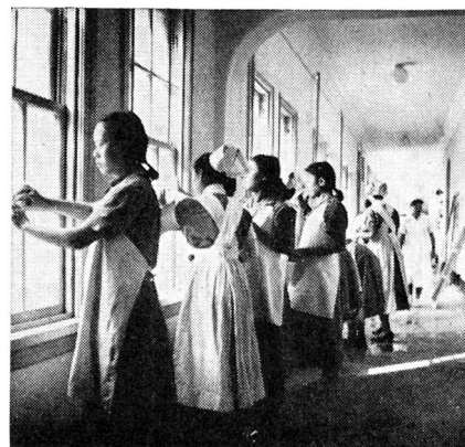
Einige Amateurbildchen von Mitgliedern unserer Medizinischen Mission in Korea.