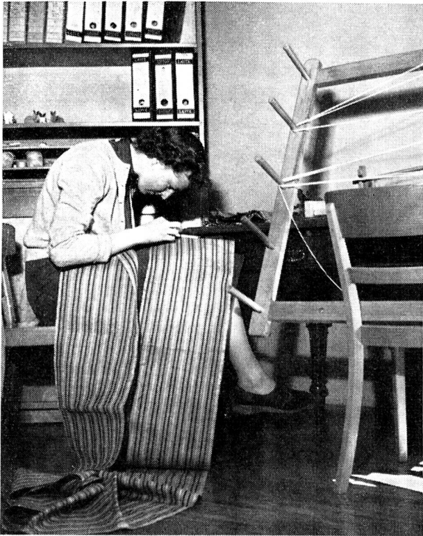
Die Beschäftigungstherapeutin der Sektion, die die Rotkreuzhelferinnen bei der Betreuung von Alten und Chronischkranken unterstützt, näht einen von einem Patienten gewebenen Stoff zusammen.