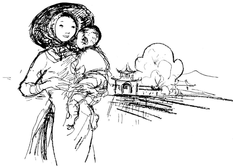
Junge Vietnamesin mit Kind. Zeichnung von Margarete Lipps, Zürich.

fängts, ist die Hilfe von oben am notwendigsten; von der Güte dieses Anfangs hängt die weitere Folge ab. Deshalb ist der Erste des Mondmonats der Tag, an dem man gewöhnlich der Gottheit seinen Besuch abstattet und sich ihrer Hilfe versichert. Am