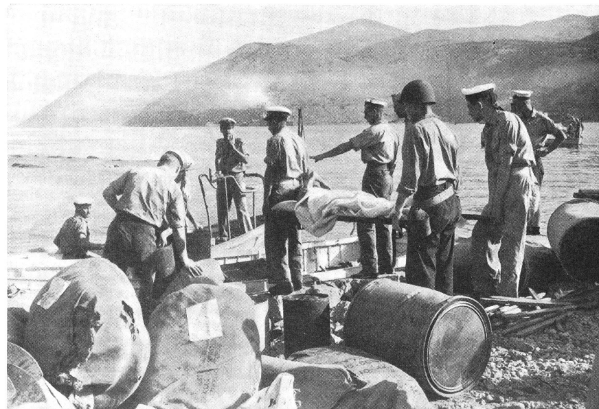
Matrosen dreier Nationen — Amerikaner, Briten und Israelis — tragen gemeinsam einen Verwundeten zu einem israelischen Boot, das ihn auf eines der israelischen Schiffe überführen wird, die in der Bucht von Argostolion, der Hauptstadt der Insel Kephallonia, ankern.

Auf den drei Fregatten spielten sich rührende Szenen ab. Die Verwundeten, meistens Bauern, küssten die Hände der Matrosen, Sanitäter und Aerzte und schauten mit Verwunderung auf ihre grauen Secuniformen mit den ihnen unverständlichen Zeichen und Beschriftungen. Das griechische Königspaar, der englische Admiral Lord Mountbatten, der aus seiner Sommerresidenz mit dem Flugzeug herbeigeeilt war, der griechische Premier Marshall Papagos, drückten in den herzlichsten Worten den Amerikanern, Engländern und Israelis ihre Dankbarkeit für die geleistete Hilfe aus.