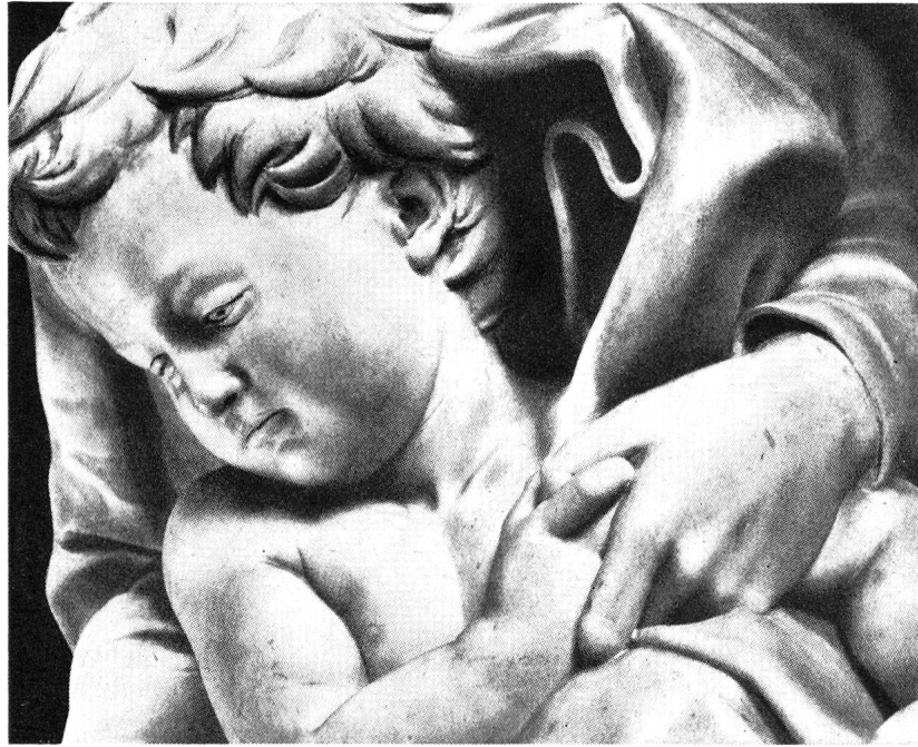
Ausschnitt aus der Madonna von Brügge.