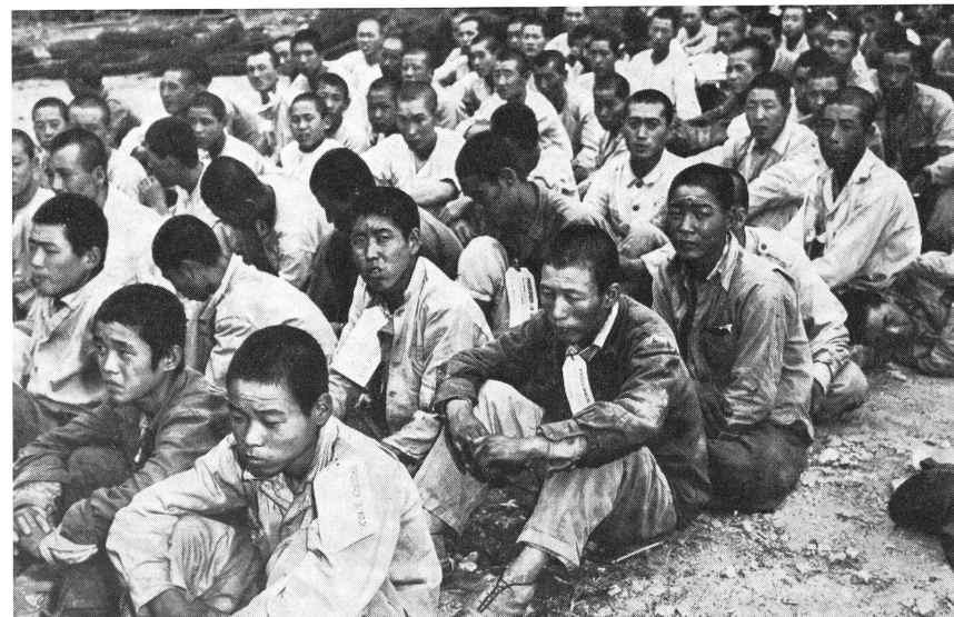
Nordkoreanische Kriegsgefangene warten auf den Abtransport in ein Lager.

Die Anregung des Roten Kreuzes scheint also eine sehr glückliche gewesen zu sein.