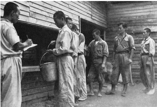
Nordkoreanische Kriegsgefangene in einem Lager von Pusan fassen eine Mahlzeit.