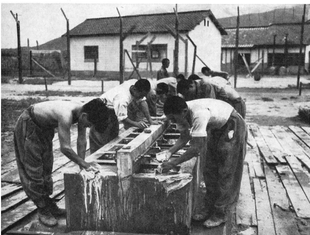
Grosse Wäsche in einem Lager für kriegsgefangene Nordkoreaner in Pusan.