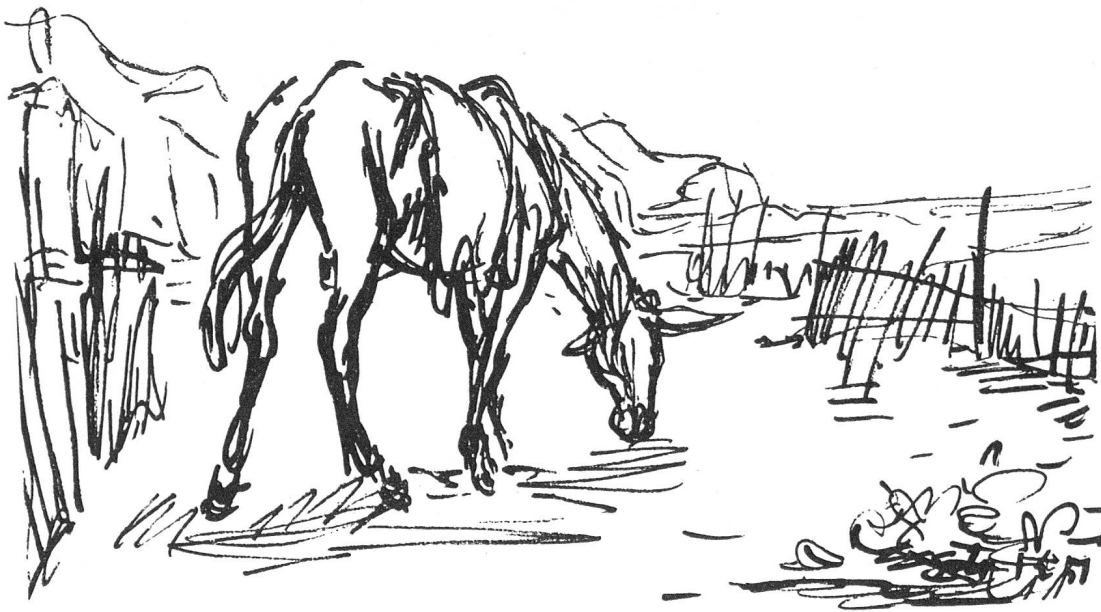
Südtalien. Maultier am Meer. Studie von Ignaz Epper, Ascona.

Einrichtung von den einstürzenden Häusern erdrückt oder die Küchen von den Fluten ausgespült worden waren. Für die Frage der zu schenkenden Kühe ist Präfekt Rizza nicht zuständig; sie wird mit dem Landwirtschaftsministerium in Rom abgeklärt werden müssen.