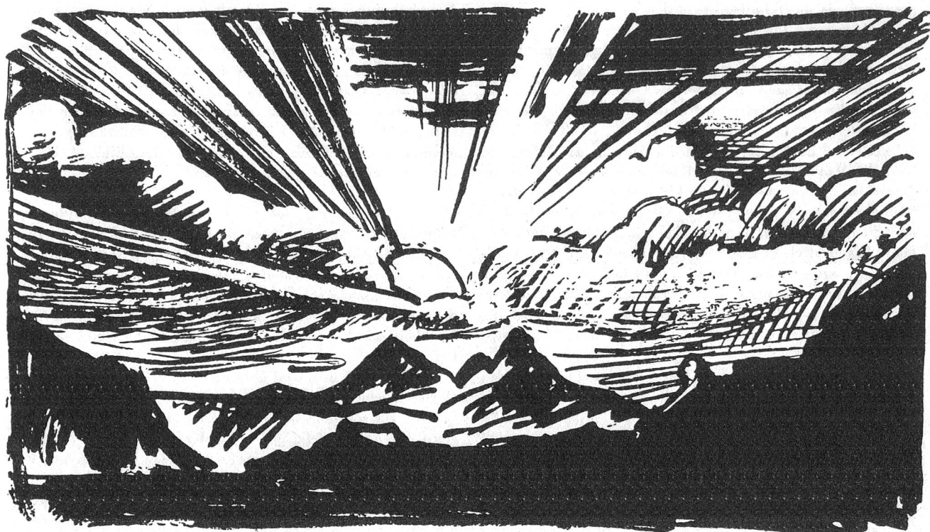
Zeichnungen Hugo Bachmann, aus «Alpina Helvetica», Verlag Ernst Bachmann, Luzern.