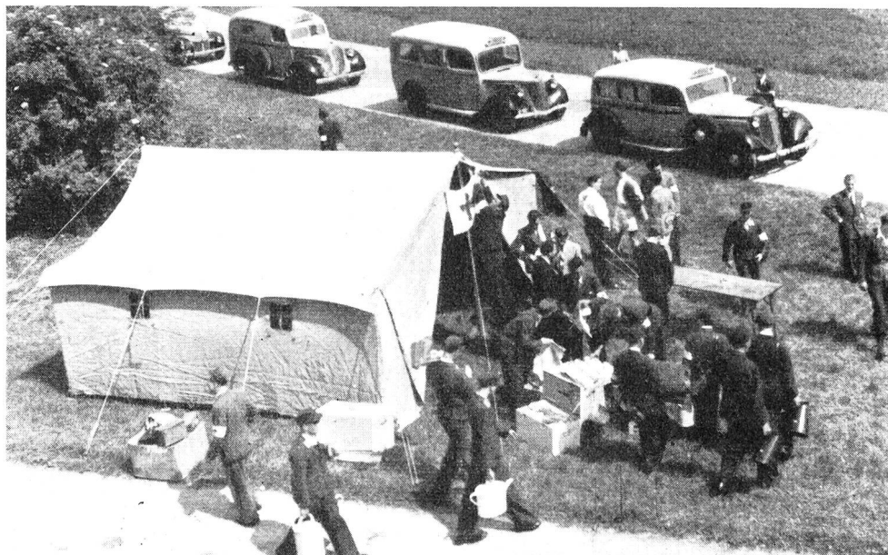
Die Katastrophen-Kolonne der Rotkreuz-Rettungsstelle Graz während einer Uebung, die anlässlich des Besuches der Delegation des Schweiz. Roten Kreuzes durchgeführt wurde.

Entwicklung der nationalen Rotkreuz-Organisation ermessen. Wie segensreich könnte sich auch in unserem Lande, aus dem Dunant und Pestalozzi hervorgegangen sind, ein Jugend-Rotkreuz auswirken! Wenn wir wirklich ein Rotkreuz-Land bleiben wollen, ein Volk, das zum roten Kreuz wie zum weissen Kreuz steht, dann müssen wir den Aufbau des Jugend-Rotkreuzes, dem Beispiel der welschen Schweiz folgend, auch in der deutschen Schweiz ohne Verzug und freudig an die Hand nehmen.