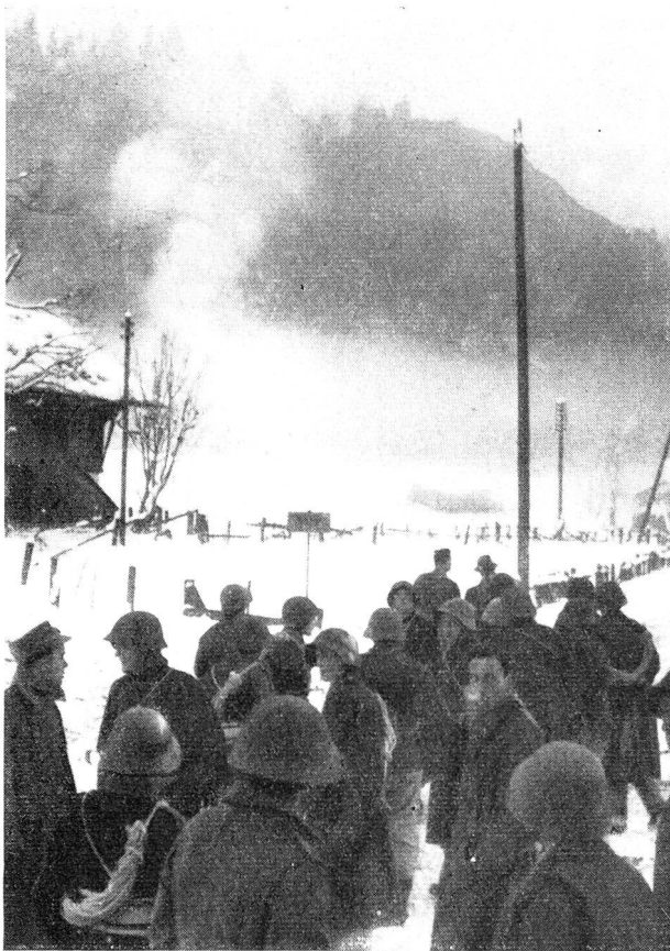
Schweres Explosions-Unglück im Munitionsdepot bei Blausee-Mitholz.