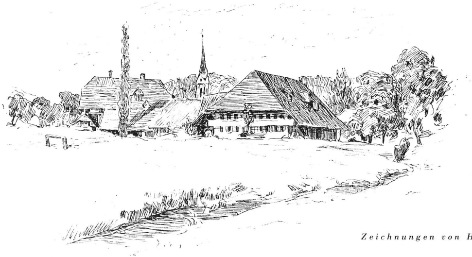
Zeichnungen von H. Bachmann