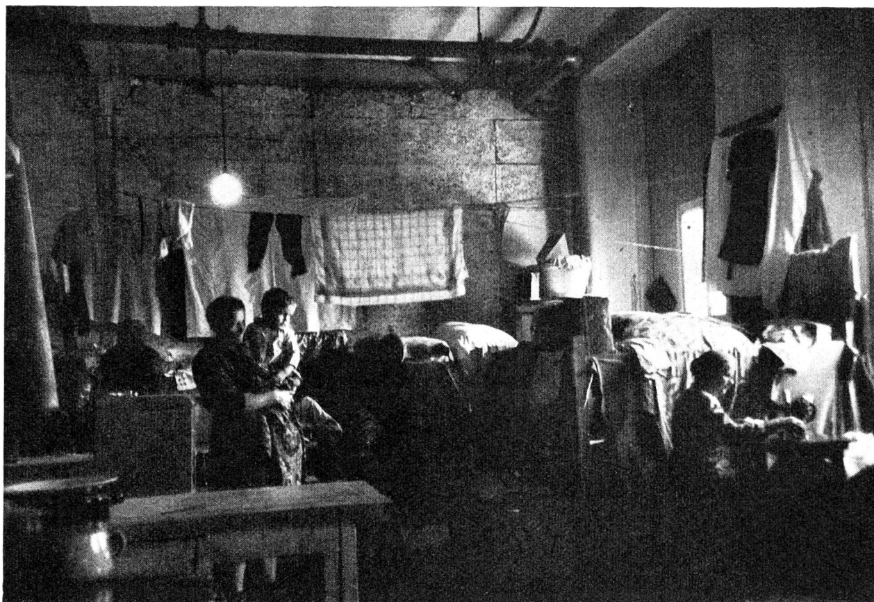
Im Zeitalter des Menschenferchs.