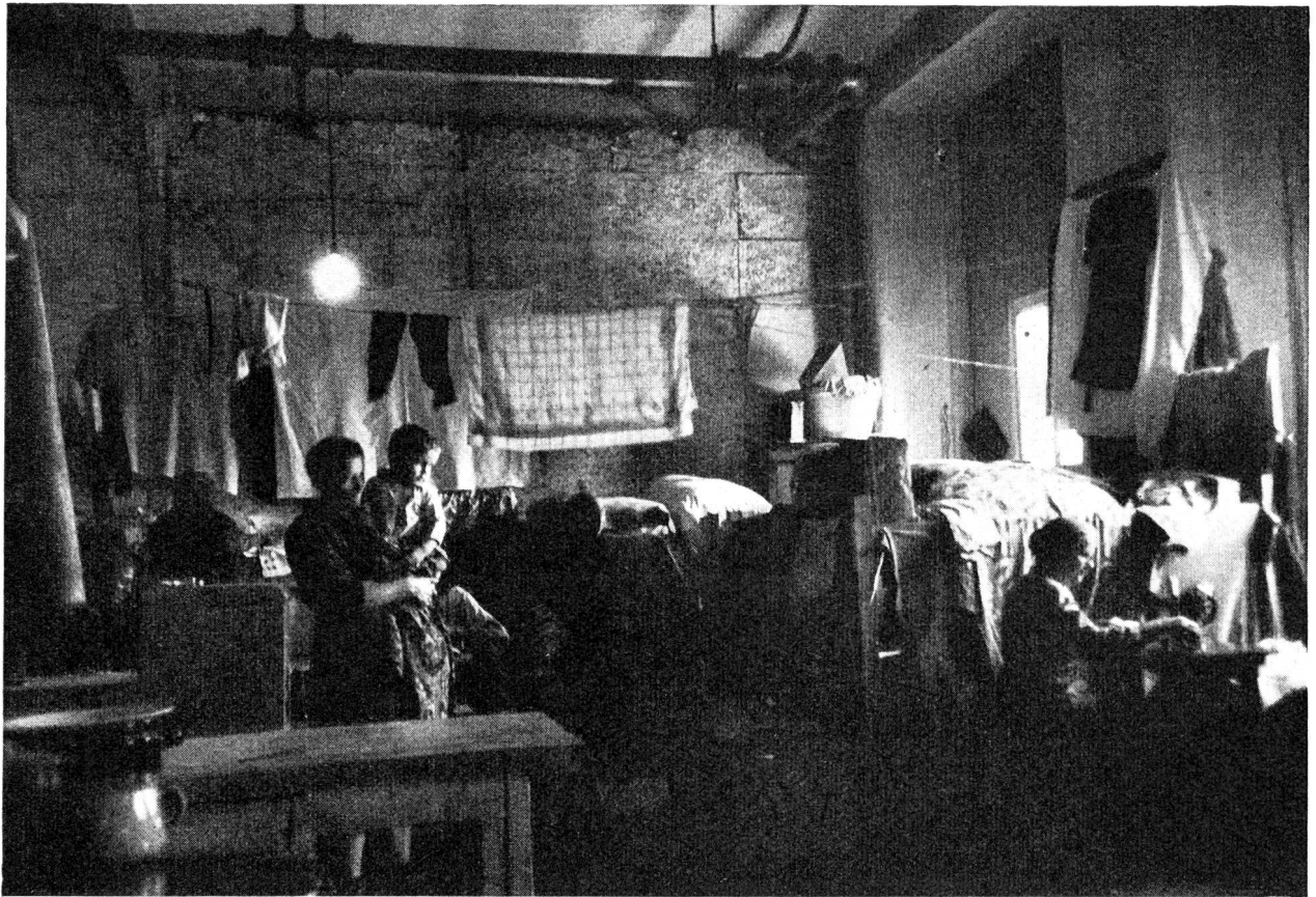
Im Zeitalter des Menschenferchs.