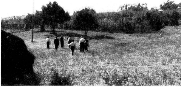
Die «Ebene» zwischen Villa und Berglehne.

noch wird Dr. B. im Asilo bleiben können. Die Gemeinde fordert immer bestimmter ihre Räume zurück. Sie braucht sie notwendig für eigene Aufgaben. Und Dr. B. muss seine Kinder wieder hinaus-schicken in die Strassen der Großstadt, wo noch Hunderte von Verdebnis bedroht sind. Seine und seiner Kinder einzige Hoffnung ist: Hilfe aus der Schweiz!