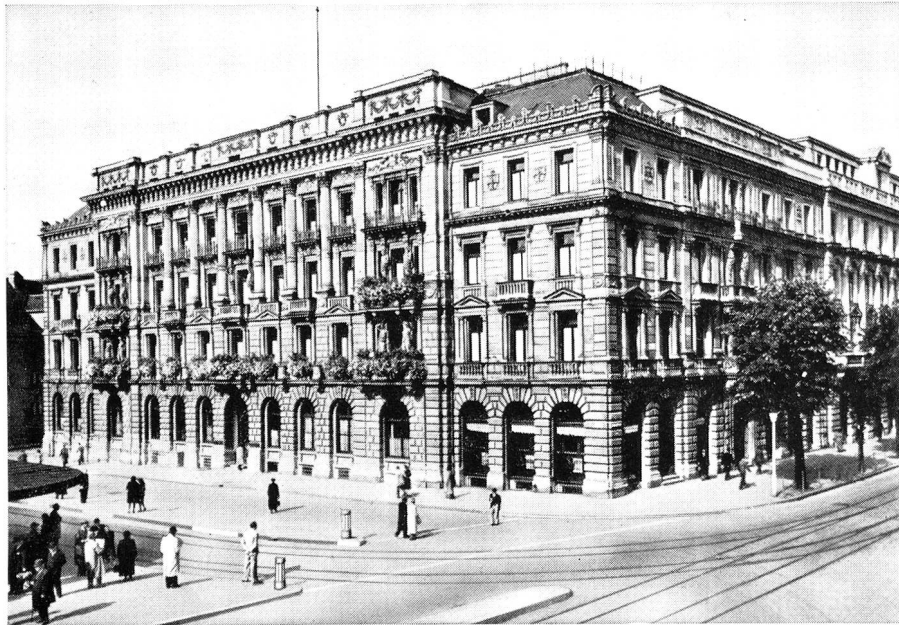
Hauptsitz in Zürich