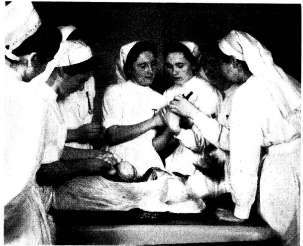
Er hat das Tagewerk der jungen Lehrschwestern unauffällig beobachtet, hat diese «Viermonatige» am Krankenbett, jene im Schulzimmer überrascht und ist auch den beiden Schülerinnen, welche einer Operation beiwohnen durften, bis in den Operationssaal gefolgt.