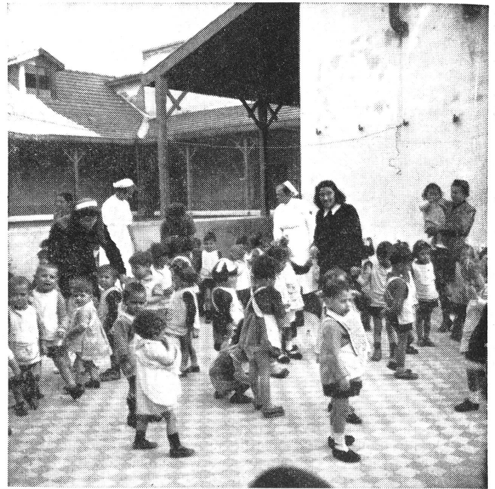
Spielterrasse der Hilfsstelle Cattolikon, Thessalonien, im April 1943.