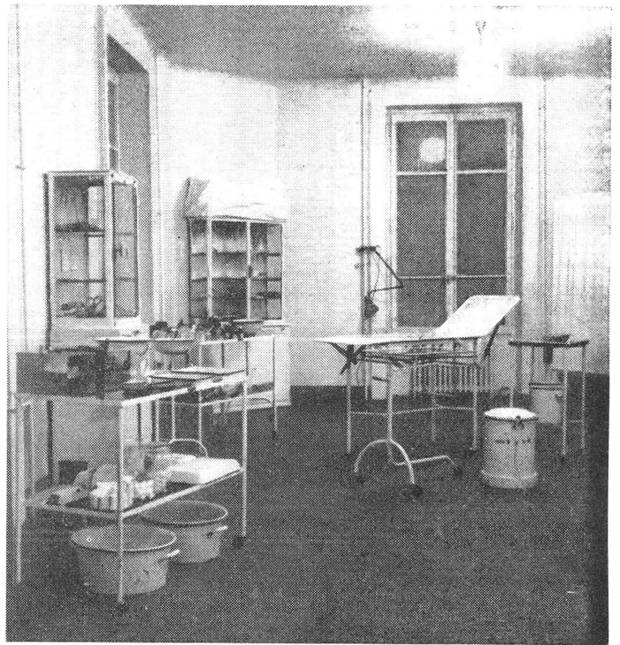
Le Dispensaire - Die Behandlungsstelle

L'effort perpétuel de l'homme doit être de diminuer la somme de la souffrance et de la cruauté; c'est le premier devoir humain.