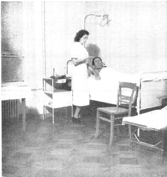
Salle de malade Krankenzimmer