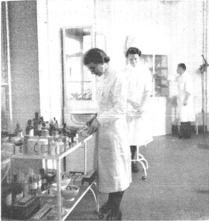
Médicaments et instruments - Medikamente und Instrumente