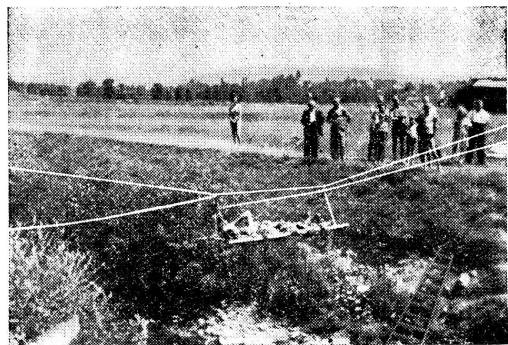
Die Seilbahn in Aktion