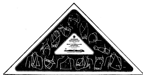
FABRIQUE INT. D'OBJETS DE PANSEMENT SCHAFFHOUSE, NEUHAUSEN

erst im Oktober. Macht Propaganda für den Mitte Oktober beginnenden Säuglingspflegekurs. Jedes melde möglichst eine Teilnehmerin an.