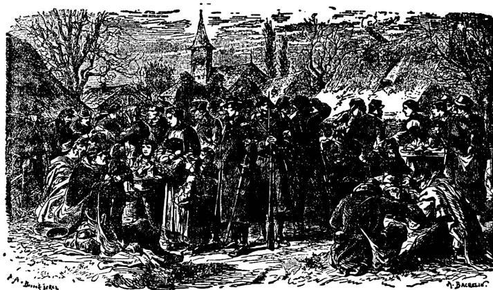
Bourbaki-Internierte in einem bernischen Dorfe, 1871

sah sich der Bundesrat erneut genötigt, einen General zu wählen und Truppen aufzubieten, und er hatte gut daran