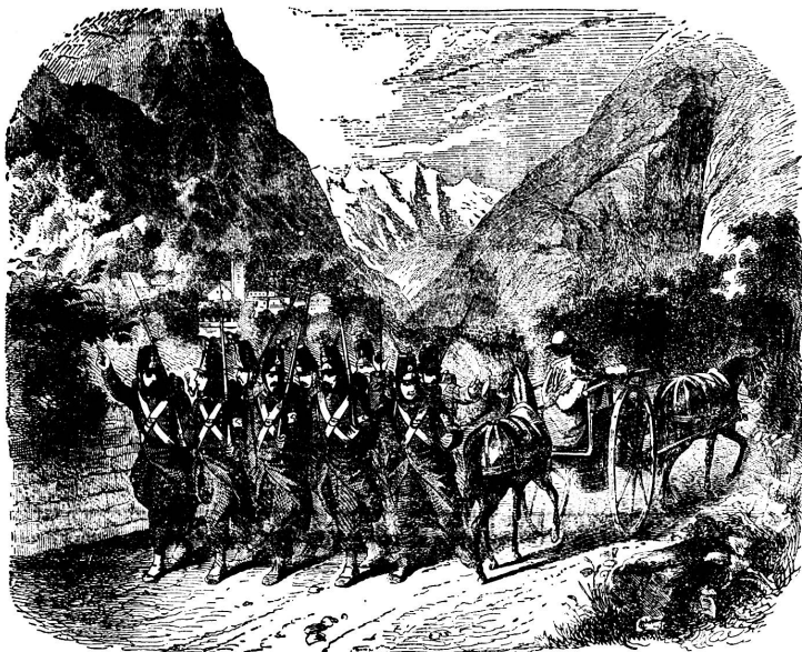
Mobilisation 1859. Schweizerische Grenzbesetzungstruppen vom St. Bernhardin herabsteigend