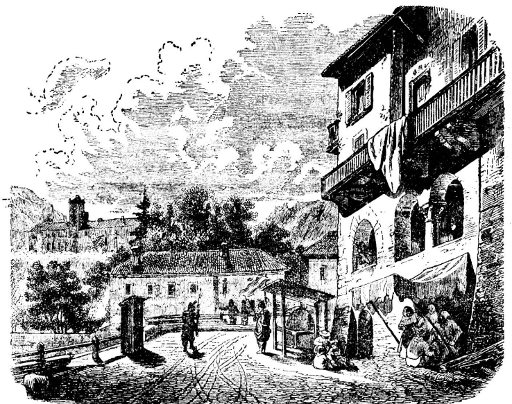
Mobilisation 1859. Wie 1945: Garibaldische Flüchtlinge verlangen Einlass beim schweizerischen Grenzposten von Ponte Tresa

in grosser Gefahr. Neuenburg war Schweizer Kanton und zugleich preussisches Fürstentum. Es kam in Neuenburg zu Zwischenfällen zwischen Royalisten und Republikanern, die zu zahlreichen Verhaftungen von Anhängern des Königs von Preussen führten, der deswegen bei der Tagsatzung intervenierte und die Freilassung seiner Tra-