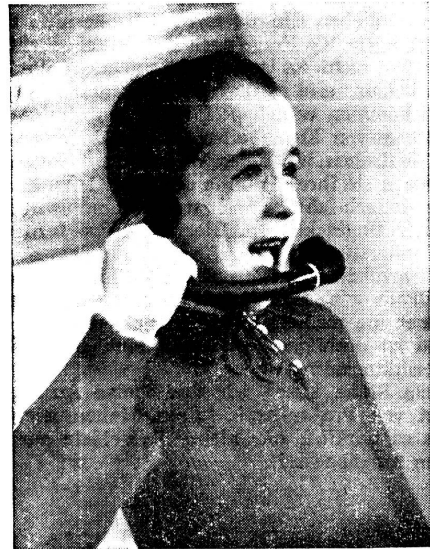
Taubstummer lernt sprechen

Sprachleiden bei Kindern sind in der Schweiz ziemlich stark verbreitet. Ein Spezialarzt für Sprachstörungen schätzte ihre Zahl vor sieben Jahren auf mehr als Zehntausend. Diese sprachgestörte Jugend setzt sich zusammen aus stammelnden und stotternden Kindern. Wie wenig weiss man im allgemeinen von den Ursachen dieser Leiden und von den Heilungsmöglichkeiten! Viele Lehrer, Jugenderzieher und Fürsorger kennen jedoch die schwer belastenden Folgen der Störungen, die sich schon in der Kindheit und erst recht im späteren Leben auswirken. Aerztliche Forschungen ergaben, dass das Stottern nicht, wie in Laienkreisen mitunter angenommen wird, eine schlechte Angewohnheit, sondern Ausdruck einer Nervenerkrankung ist. Das Stammelnde dagegen ist zurückzuführen auf die gehemmte Sprachentwicklung, auf mangelhafte Aufmerksamkeit und Merk-