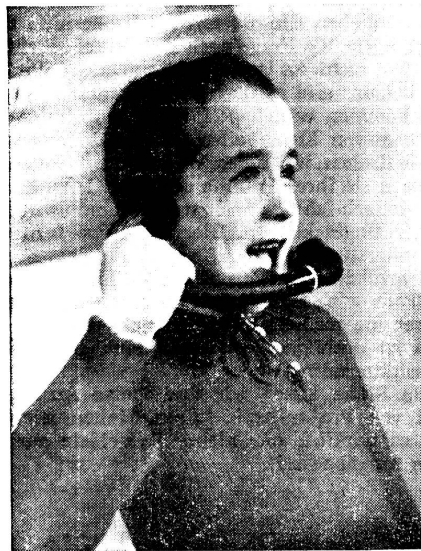
Taubstummer lernt sprechen

Sprachleiden bei Kindern sind in der Schweiz ziemlich stark verbreitet. Ein Spezialarzt für Sprachstörungen schätzte ihre Zahl vor sieben Jahren auf mehr als Zehntausend. Diese sprachgestörte Jugend setzt sich zusammen aus stammelnden und stotternden Kindern. Wie wenig weiss man im allgemeinen von den Ursachen dieser Leiden und von den Heilungsmöglichkeiten! Viele Lehrer, Jugenderzieher und Fürsorger kennen jedoch die schwer belastenden Folgen der Störungen, die sich schon in der Kindheit und erst recht im späteren Leben auswirken. Aerztliche Forschungen ergaben, dass das Stottern nicht, wie in Laienkreisen mitunter angenommen wird, eine schlechte Angewohnheit, sondern Ausdruck einer Nervenerkrankung ist. Das Stammelnde dagegen ist zurückzuführen auf die gehemmte Sprachentwicklung, auf mangelhafte Aufmerksamkeit und Merk-