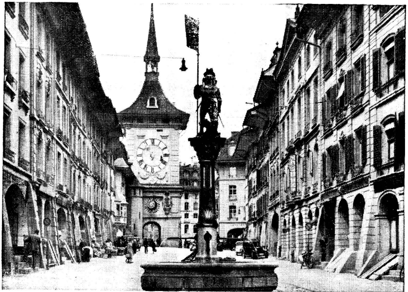
Zeitglockenturm — Tour de l'Horloge.