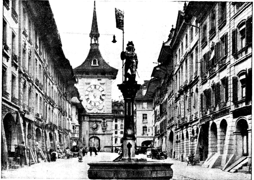
Zeitlockenturm — Tour de l'Horloge.