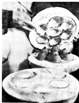
Die angesaugte Tonkruste ist dick und fest genug geworden, um die Gipsform öffnen und die Beckeli herauschälen zu können.

Kauft deshalb am 5. Mai ein Beckeli, füllt es mit Geldstücken — in diesem Jahr geht auch ein Einfrankenstück hinein — und bringt das gefüllte Beckeli zur Kinderhilfe zurück!