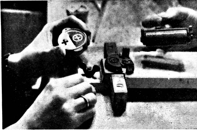
Das Zeichen des Roten Kreuzes und der Schweizer Spende werden auf den Beckelideckel gestempelt.

Les insignes de la Croix-Rouge et du Don suisse sont imprimés sur le couvercle du petit pot.