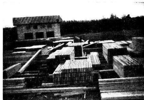
Das von der Schweizer Spende zur Verfügung gestellte Bauholz wird in St-Hilaire-du-Rosier (Isère) abgeladen und gelagert.

Von Anfang an war vorgesehen, die Hilfsaktion für den Vercors zeitlich in zwei Abschnitten durchzuführen. Die erste Teilaktion, die eben beendet worden ist, hat die Einrichtung von fünf Werkplätzen und den Versand von 800 m 3 Bauholz sowie 2540 m 2 Dachpappe erlaubt. 200 Einzelwerkzeugkisten ergänzen dieses erste Unternehmen. Sie sind den Empfängern zusammen mit einer Botschaft des Schweizervolkes ausgehändigt worden. In der Botschaft wird zum Aus-