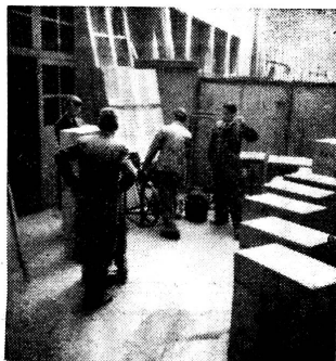
Maurer- und Zimmermannskisten mit den entsprechenden Assortimenten werden in Bern zusammengestellt und verladebereit gemacht.