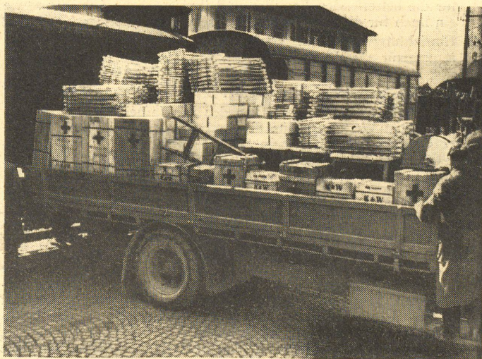
Bahnhof Bern: Bahnverlad der Werkzeuge und Kisten.

Contenu d'une des 200 caisses individuelles destinées aux sinistrés du Vercors.