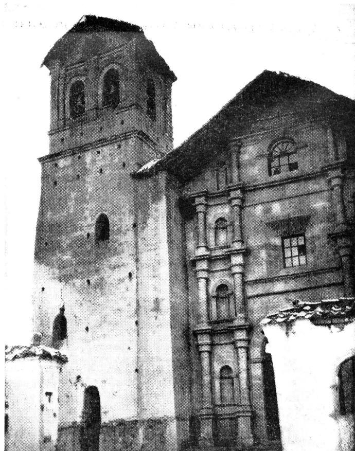
Einer der beiden Türme der aus Lehm erbauten Kirche in Yaco.