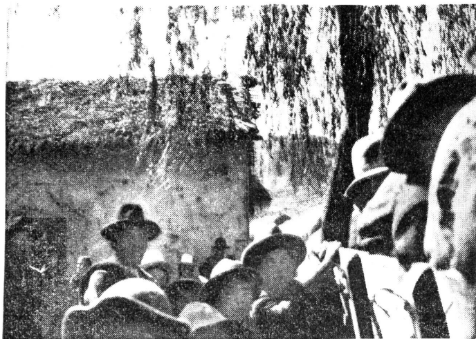
Der erste Lastwagen in Yaco - Le premier camion à Yaco

Versteht ihr nun, warum ich mich in diesem kleinen, sauberen Truppenkranken- und Zimmer so sehr zu Hause fühle? (Fortsetzung folgt.)