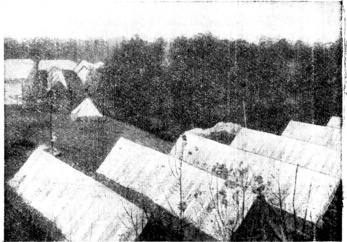
Ein vom amerikanischen Roten Kreuz eingerichtetes Spitaldorf. Un village-hôpital organisé par la Croix-Rouge américaine.

sationen der verschiedenen Länder durch rasches, zielbewusstes Handeln unschätzbare Hilfe geleistet. So zeigt unser Bild ein durch das amerikanische Rote Kreuz in der Umgebung von Tokio eingerichtetes Spitaldorf.