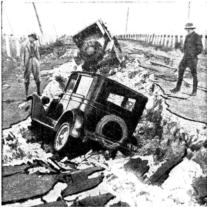
Durch Erdbeben zerstörte Strasse. Rue détruite par le tremblement de terre.

Besonders verheerend sind die bei Meerbeben entstehenden grossen Wasserwellen. Infolge der Bruchbildung kann der Meeresboden plötzlich ganz beträchtlich gehoben oder gesenkt werden. Es sind momentane Hebungen von über hundert Metern bekannt. Dadurch entstehen gewaltige Wasserwellen, die die benachbarten Küsten überfluten, die Hafenanlagen eindrücken, Dampfer zum Stranden bringen, ja selbst die Bevölkerung ganzer Städte ertränken.