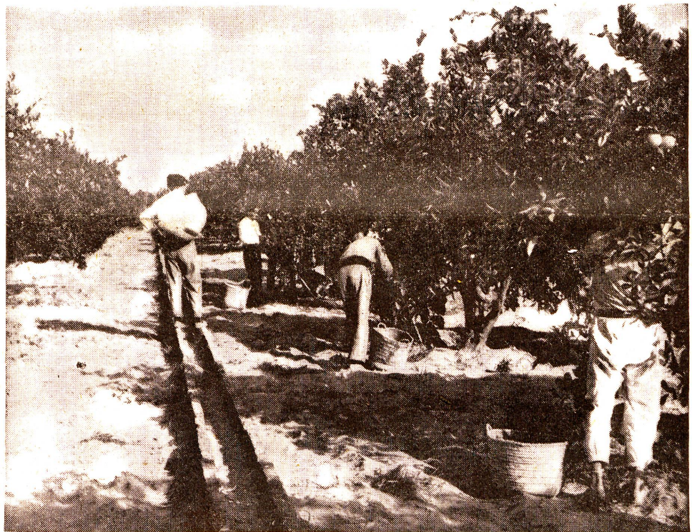
Orangenernte in Spanien