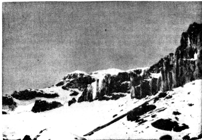
Aufstieg auf den Sajama

Sektion Zürich. 6. 3. 44, Höck, FHD-Haus, 2000. — 14. 3. 44, Amthaus V, 1930: Administrative Uebung. Leitung: Lt. Jaquemet. — 28. 3. 44, Weisser Wind, 2000, Jahresversammlung der Sektion. Leitung: Der Arbeitsausschuss. — FHD-Turnen: Freitags 1900—2000, Sihlhölzli-Turnhalle.