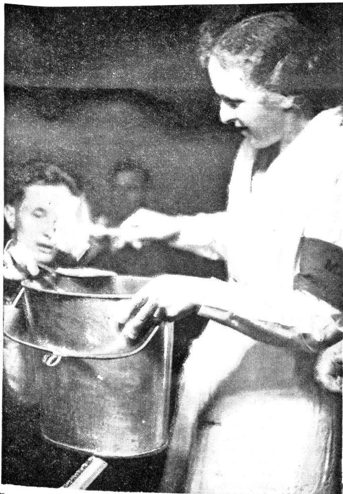
Eine FHD der Gattung 10 hilft bei der Verpflegung.