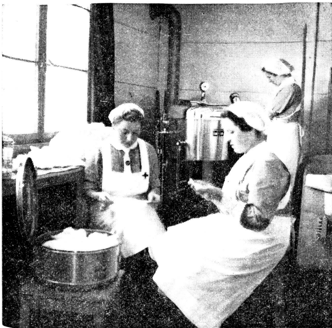
Krankenschwestern desinfizieren Verbandstoffe. Des infirmières désinfectent des pansements.

Le Médecin en chef de l'armée, Vollenweider, col.-brig.