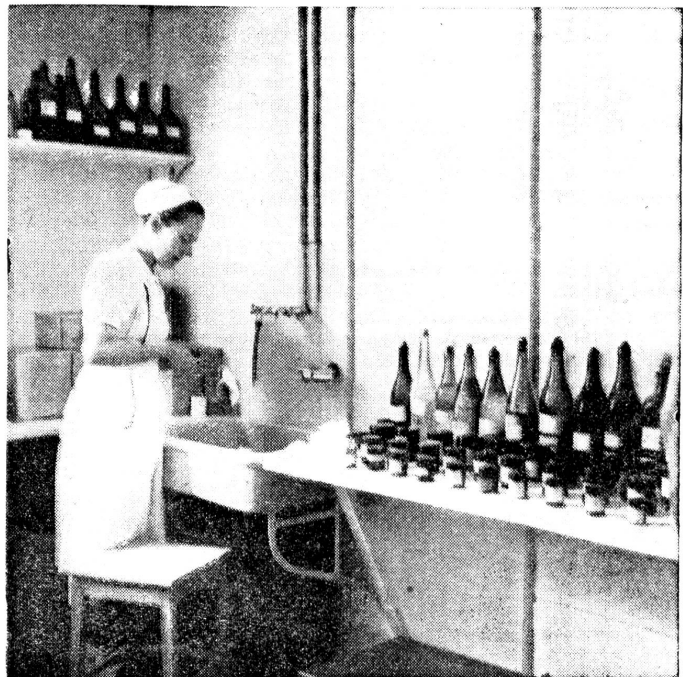
Im Laboratorium einer MSA Au laboratoire d'un ESM