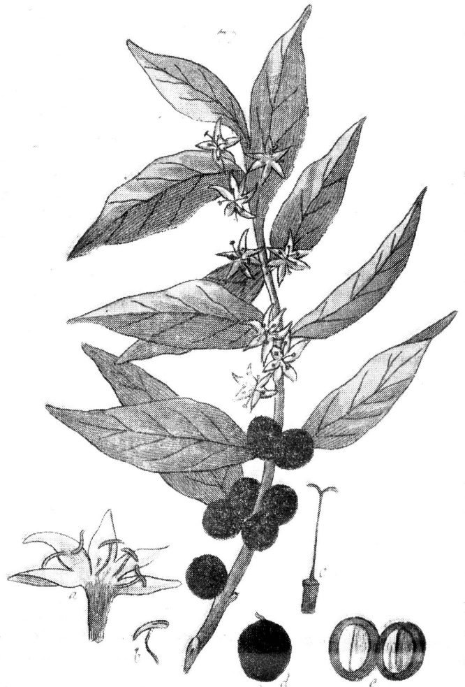
Zweig des arabischen Kaffeebaumes. Coffea arabica Une branche du caféier arabe

Die abgelesenen Früchte also werden in einen Sack gefüllt und vor der Hütte in einen grossen Bottich geschüttet. Während einiger Tage kümmert sich niemand mehr um sie. Unterdessen fault das Fleisch der Früchte; wir nennen das fermentieren. Sobald es sich leicht von dem Samen löst, bearbeitet das Indianerweib den Bottichinhalt mit einem Holzmörser, bis die Kerne — die Kaffeebohnen — blossliegen. Diese werden an der Luft getrocknet. Noch sind die Bohnen selbst in eine äusserst dünne, durchsichtige Samenschale, die