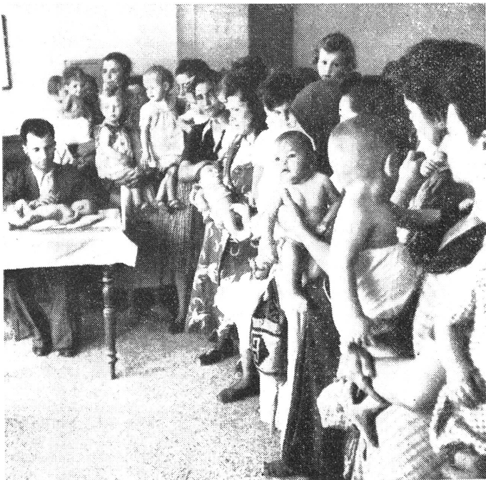
Aerztliche Untersuchung in einem der vielen Zentren Visite hebdomadaire du docteur

Unsere Mission erachtete es als wichtig, einen ärztlichen Dienst unmittelbar in den Milchverteilungscentren, wo die Kinder täglich zusammenströmen, einzurichten. Aus Mangel an allem stellten sich diesem Dienst zuerst grosse Schwierigkeiten entgegen. Nach Ankunft grösserer Milch- und Medikamentenmengen aus Kanada jedoch konnten den Aerzten die notwendigen Mittel zur Pflege und Stärkung der Kinder zur Verfügung gestellt werden.