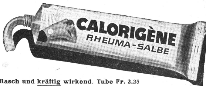
Rasch und kräftig wirkend. Tube Fr. 2.25