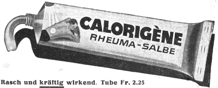
Rasch und kräftig wirkend. Tube Fr. 2.25

Zofingen. S.-V. 12. Sept. Frau Sonne versteckte sich hinter den Regenschleusen, wir betrachteten dies aber als Gewitterstimmung und beschlossen, gleichwohl auszufliessen, denn Richtung Jura war es hell. Unser Programm war: Fahrt nach Hägendorf, Aufstieg durch die Teufelsschlucht, Allerheiligenberg, Belchen und Abstieg über Ifenthal, Trimbach, Olten. Verpflegung aus dem Rucksack. Wir hatten es nicht zu bereuen. Die Teufelsschlucht zeigte sich in schönstem Festgewande, die Sonne schuf eine märchenhafte Beleuchtung, und als wir ins freie Feld traten, spannte sich über uns wolkenloser Himmel. Die Aussicht war herrlich, aber das schönste Panorama wartete uns auf dem Belchen. Das obere Baselbiet lag in spätsommerlicher Stimmung zu unsern Füssen. Der Abstieg brachte verschiedene Abwechslungen. Unser Leiter, E. Hodel, erteilte bald den Befehl zum Bau einer Bahre für Verwundetentransport. Das Material dazu holten wir aus