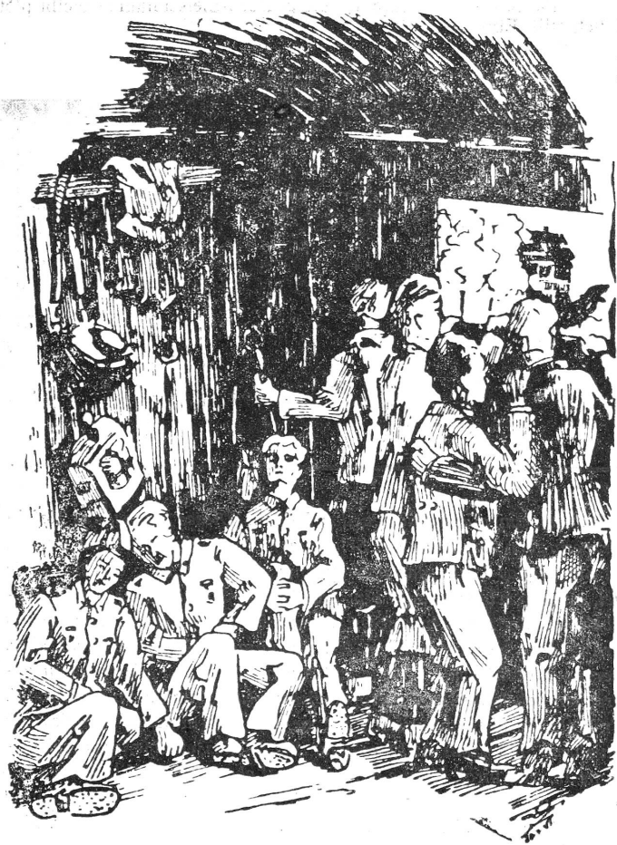
Unbekannte Dörfer und Städte fliegen an den kleinen Fenstern vorbei. Certains somnolent, d'autres observent les fugitives images du paysage; dans un coin on parle d'hier, dans un autre de demain...