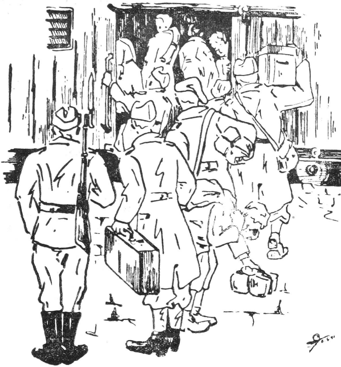
Abfahrt ins «Kommando». Départ pour le «Kommando».

Das Suchen nach einer Unterkunft füllt den ersten Tag im «Kommando» aus. Anderntags beginnt die Arbeit. Beim Morgenappell fassen die Kriegsgefangenen das Werkzeug, und sie werden auf einen Bauplatz geführt. Die Arbeit wird rasch organisiert und das Hin- und Herrollen der kleinen Rollwagen zwingt bald jeden in den Arbeitsgang. Die Arbeit ist ungewohnt, es fehlt an Begeisterung, bald schmer-