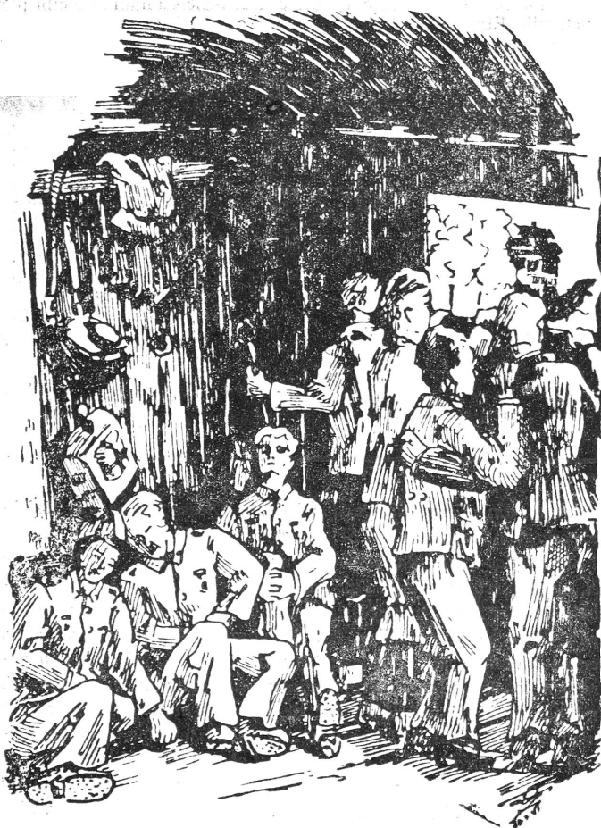
Unbekannte Dörfer und Städte fliegen an den kleinen Fenstern vorbei. Certains somnolent, d'autres observent les fugitives images du paysage; dans un coin on parle d'hier, dans un autre de demain...