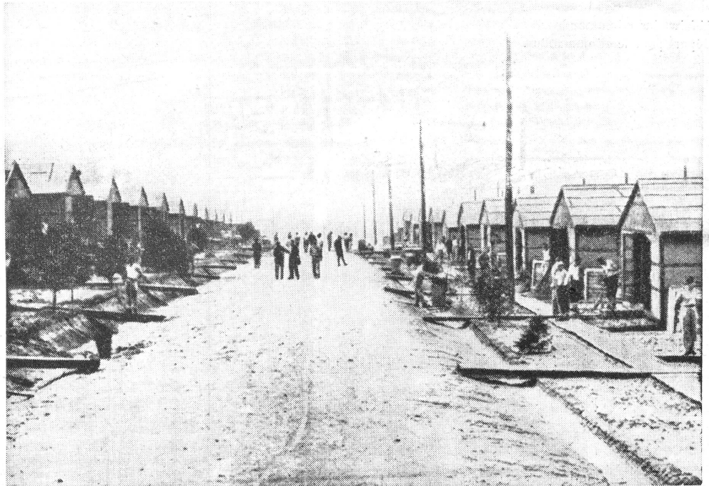
Ein Kriegsgefangenenlager in Amerika

Eine der wichtigsten Aufgaben, die dem Internationalen Komitee vom Roten Kreuz zufällt, ist die Uebermittlung von Sendungen an Kriegsgefangene und Internierte.