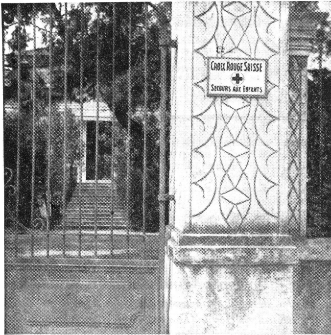
Eingang zur Hilfsstelle des Schweizerischen Roten Kreuzes, Kinderhilfe, in Heronia, Thessalonien.