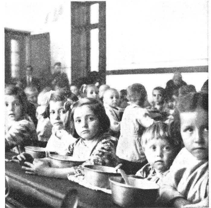
Heute sind sie gesund und kräftig.

Centre Menisi Voici ce dont les enfants avaient l'air, il y a un an. 282