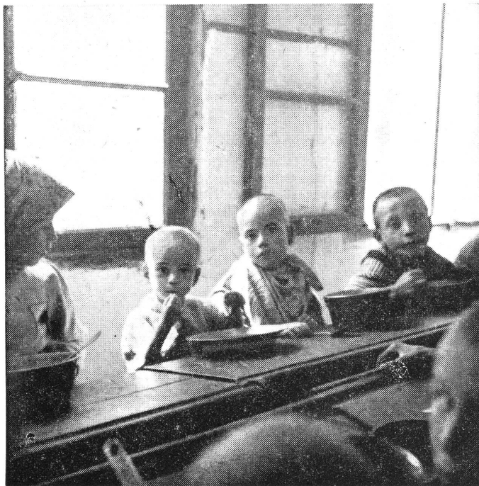
Hilfsstelle Menisi So sahen die Kinder vor einem Jahr aus...

Zusammenfassend kann über den gesundheitlichen Zustand der Kinder beider Krippen gesagt werden, dass er zurzeit durchwegs gut ist. Eine weitere Besserung ist mit Sicherheit noch zu erwarten. Abgesehen davon, fällt mir die schlechte Bekleidung der Kinder auf.