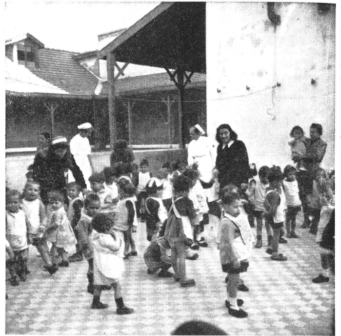
Spielerterrasse der Hilfsstelle Cattolikon, Thessalonien, im April 1943.