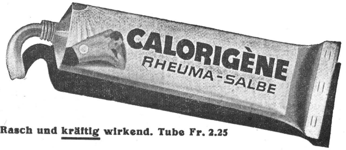
Rasch und kräftig wirkend. Tube Fr. 2.25

Auch von zwei Gattungen der griechischen Werke des Friedens