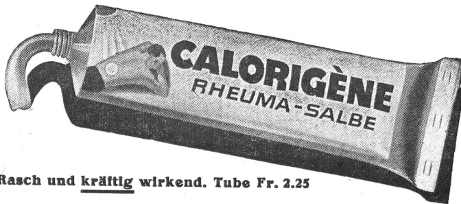
Rasch und kräftig wirkend. Tube Fr. 2.25

Auch von zwei Gattungen der griechischen Werke des Friedens