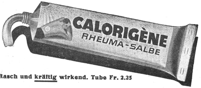
Rasch und kräftig wirkend. Tube Fr. 2.25

Auch von zwei Gattungen der griechischen Werke des Friedens