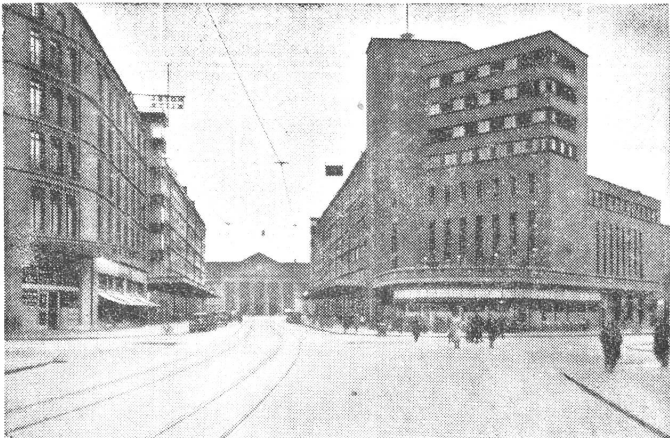
Das moderne Biel. - Bienne moderne