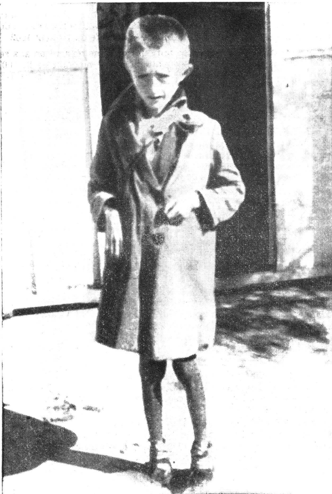
Hungerndes Kind in Griechenland Enfant grec souffrant de la faim 200

Gruppe Frauenfeld: Turnen am 15. Mai, 18.30, Ergaten-Schulhaus.