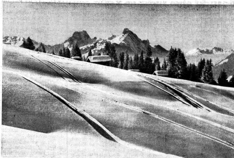
Skispuren - Traces de ski