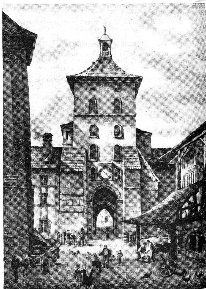
Le Jacquemard ou la Tour des prisons à Fribourg, démoli en 1853