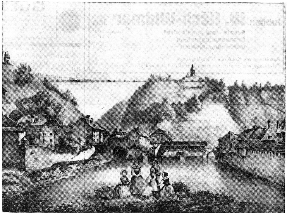
Die Freiburger Hängebrücke oberhalb der alten Stadt