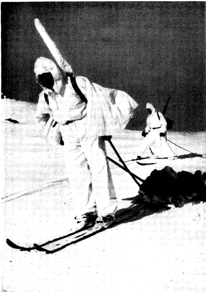
Der Rettungsschlitten im Hochgebirgsdienst dient der Bergung Verwundeter und Verletzter. (Zensur-Nr.: Photopress VI Br. 2274.)