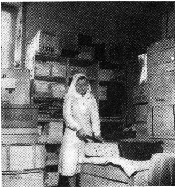
Das Magazin der schweizerischen Hilfsstelle in Auch.