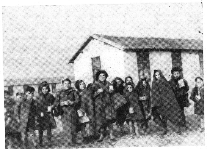
Die Kinder schützen sich vor der Kälte so gut es geht. Früh schon haben sie die Sorge um Nahrung, Kleidung und Unterkunft kennen gelernt, Sorgen, die den meisten Kindern in normalen Zeiten von liebevollen Eltern ferngehalten werden.