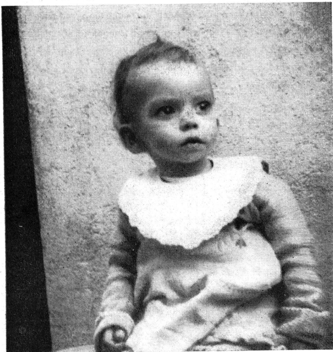
Ein vom Hunger gezeichnetes Kleinkind, das in der «Pouponnière Suisse» in Banyuls Aufnahme fand.

Hedingen. S.-V. Beginn des Samariterkurses: 6. Januar, Restaurant «Post», für Aktive sind drei praktische und drei theoretische Abende obligatorisch.