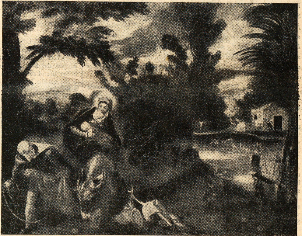
Tintoretto: Die Flucht nach Aegypten

ora anch'io ti voglio dar l'anima mia che d'esser teco ognor tanto desia.