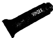
VINDEX-Wundsalbe für Wunden, die nicht verbunden werden.

FLAWA, Schweizer Verbandstoff-Fabriken AG., Flawil