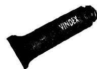
VINDEX-Wundsalbe für Wunden, die nicht verbunden werden.

Seit über 20 Jahren bestens bewährt VINDEX