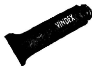
VINDEX-Wundsalbe für Wunden, die nicht verbunden werden.