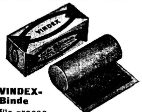
VINDEX-Binde für grosse Verwundungen, Verbrennungen etc.

FLAWA, Schweizer Verbandstoff-Fabriken AG., Flawil