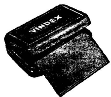
25 VINDEX-Kompressen fertig zugeschnitten

Kirchberg (Bern). S.-V. Wir machen unsere Mitglieder darauf aufmerksam, dass Austritte schriftlich dem Präsidenten einzureichen sind. Um eine bereinigte Abonnentenliste einreichen zu können, bitten wir, den Termin bis und mit 24. Dezember einzuhalten. Denjenigen,