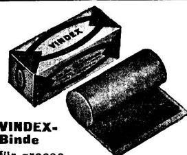
VINDEX-Binde für grosse Verbände, Verbrennungen etc.

FLAWA, Schweizer Verbandstoff-Fabriken AG., Flawil