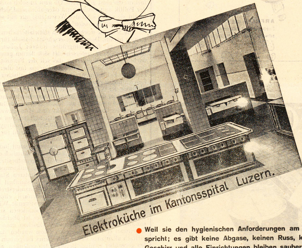
Elektroküche im Kantonsspital Luzern.