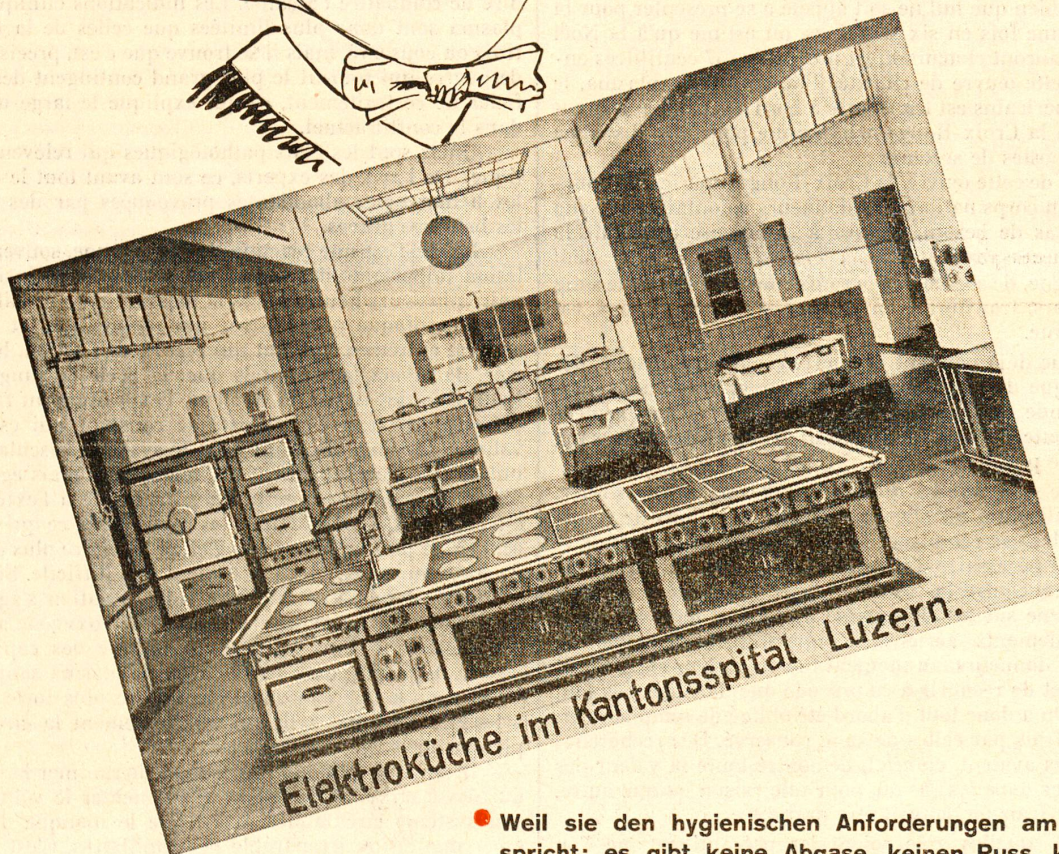
Elektroküche im Kantonsspital Luzern.