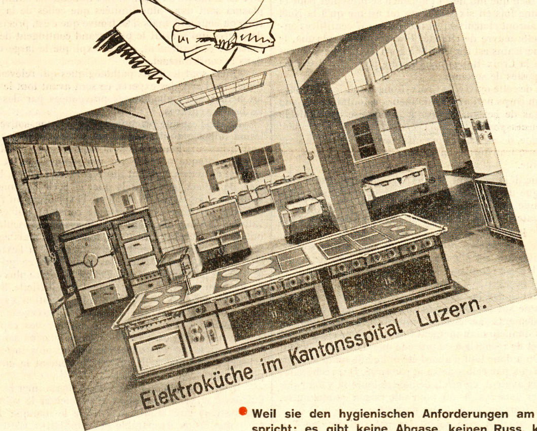
Elektroküche im Kantonsspital Luzern.