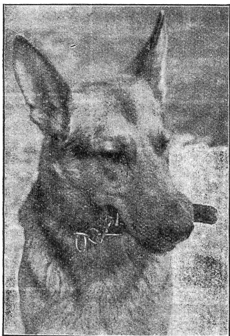
Sobald der Sanitätshund einen Verwundeten gefunden hat, fasst er das am Halsband befestigte Apportel und kehrt zu seinem Führer zurück. (Zensur-Nr. A/Fi/0043.)

Hund einen Verwundeten gefunden hat, das Tier wird an die lange Leine genommen, und es führt nun seinen Führer in raschster Gangart zu dem Hilfsbedürftigen. Sobald die erste Hilfe verabfolgt ist, d. h. der Verwundete richtig gelagert, gelabt und verbunden ist, signalisiert der Hundeführer die Fundstelle seinem Gruppenführer, der nun seinerseits die Meldung mit Kroki an die Sanitätskompanie zurückgibt, die durch ihre Gefechts-Sanitätspatrouillen oder durch Trägertruppen die Abräumung des Gefechtsfeldes besorgt. Der Sanitätshund arbeitet aber indessen ohne Zeitverlust mit seinem Führer weiter; jeder Winkel, jede Hecke und jeder Busch wird rastlos und unermüdlich abgesucht und ein Gefechtsfeld, das von Sanitätshunden durchstöbert wurde, darf ohne weiteres als vollständig abgeräumt betrachtet werden. Es ist geradezu rührend, zu beobachten, wie die Tiere oft unter Einsatz der letzten Kräfte mit dem Apportel im Maul zu ihrem Führer zurückrasen,